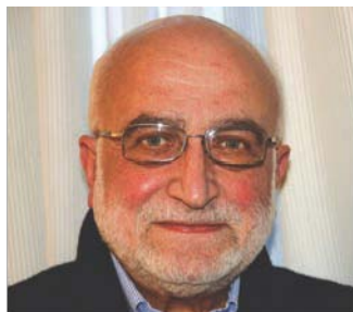
di Italo Tanoni

www.italotanoni.it i.tanoni@innovatioeducativa.it